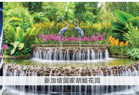
新加坡国家胡姬花园