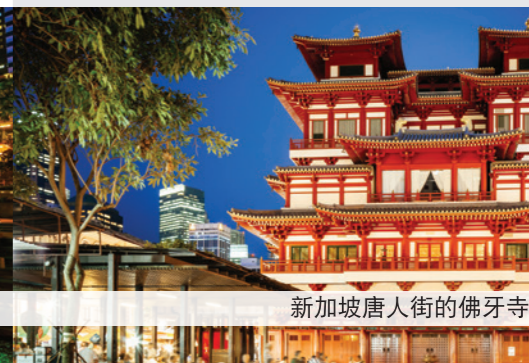
新加坡唐人街的佛牙寺