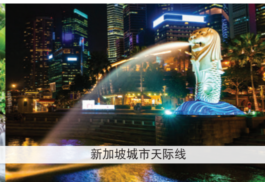
新加坡城市天际线