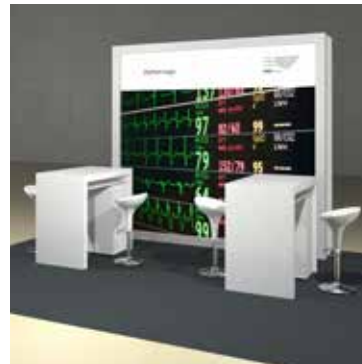
Beispiel Partnerstand mit beleuchteter Rückwand und Branding