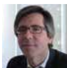
HENRIQUE MARTINS CEO do Serviços Partilhados do Ministério da Saúde, Governo de Portugal