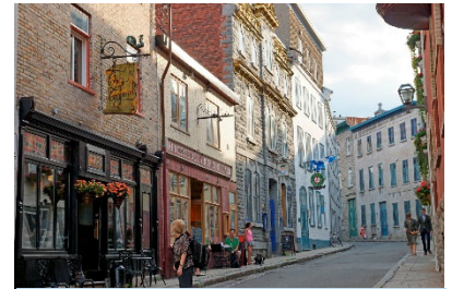
Rue Couillard, Vieux-Québec