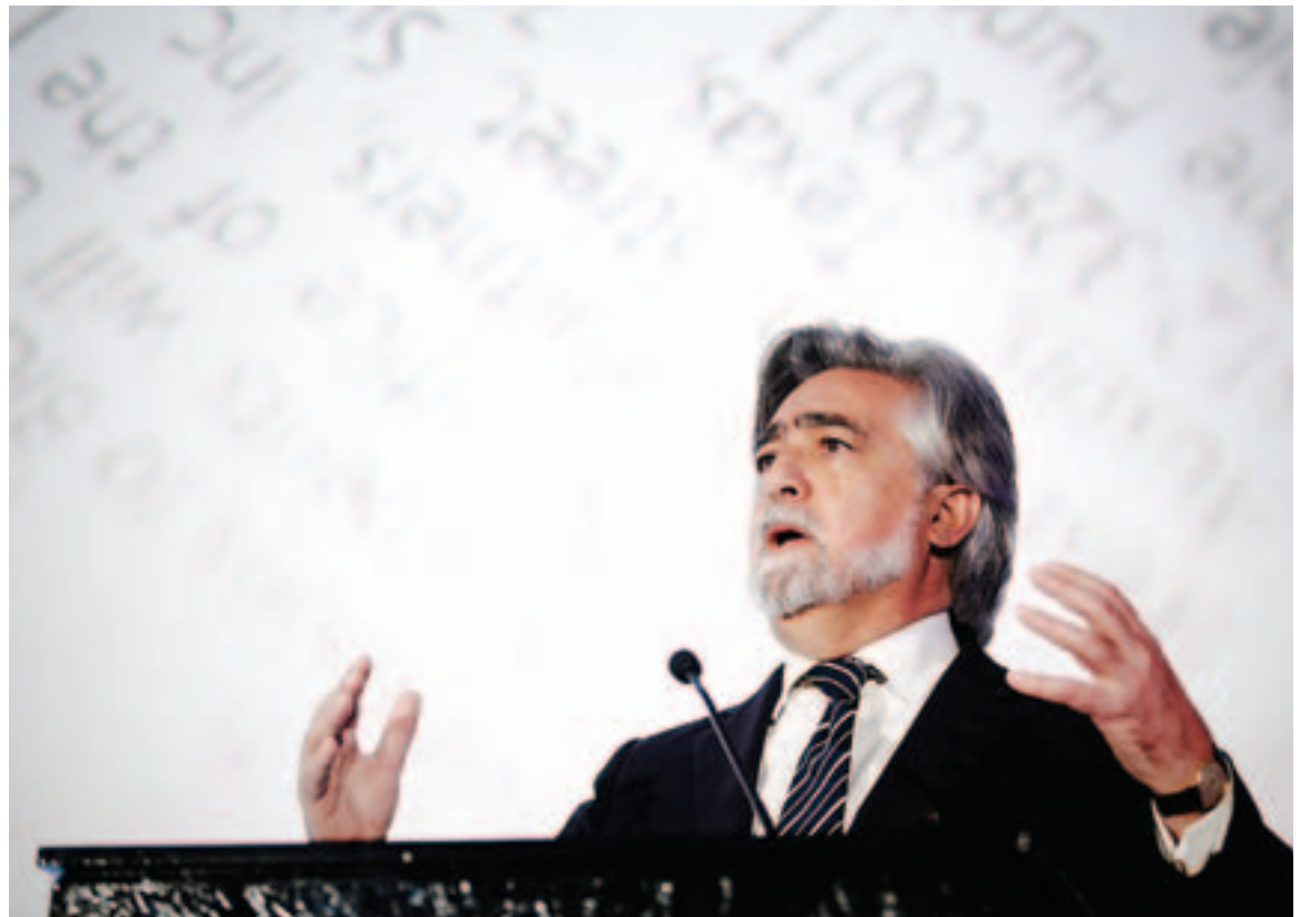
Luís Amado | O ex-governante entende que a zona franca pode ajudar Portugal a tornar-se competitivo no plano internacional.