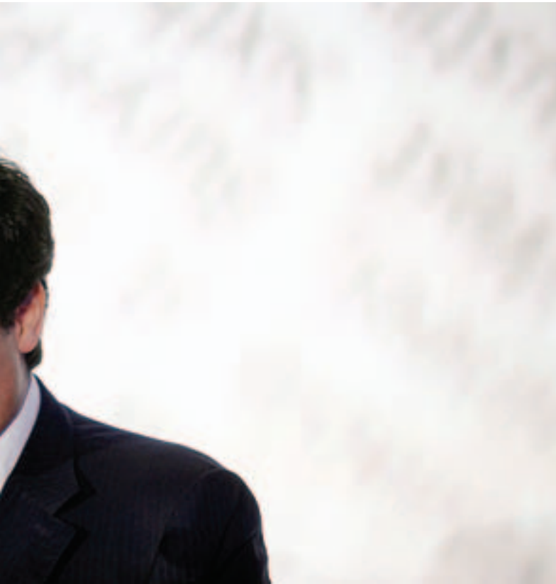
iança que são vários os instrumentos fiscais que ainda favorecem a ZFM.