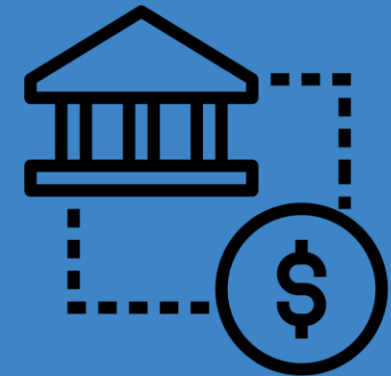
Oportunidades en las adyacencias